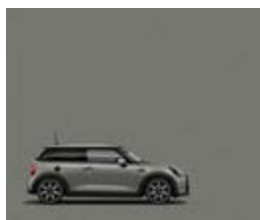
Serienfarbe Moonwalk Grey