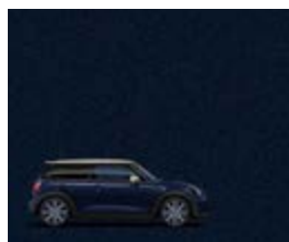
Sonderfarbe MINI Yours Enigmatic Black