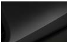
Hazy Grey 3