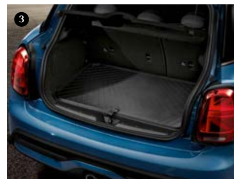
❶ Dachbox 320, schwarz. ❷ Allwetter-Fußmatten. ❸ Gepäckraum-Formmatte, essential-schwarz