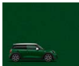
British Racing Green