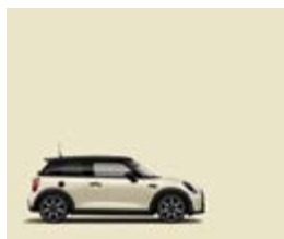
Pepper White 2/4